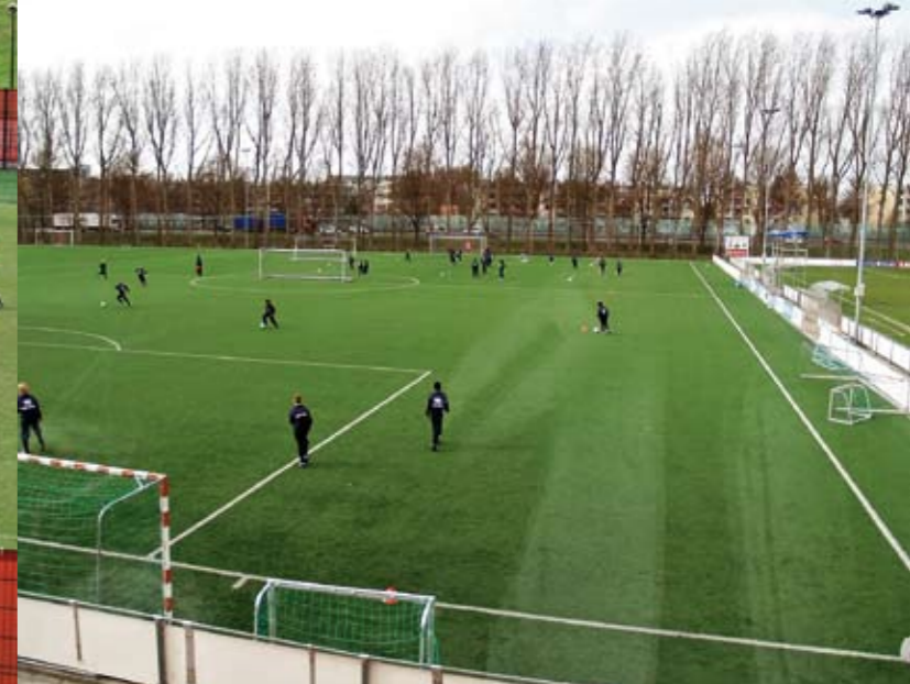
Kentät täyttyvät iltapäivällä pelaajista.

ta joka toinen vuosi ykkösjoukkueeseen. Paitsi jalkapallotaitoja akatemiassa opetetaan pelaajille myös muita elämän taitoja.