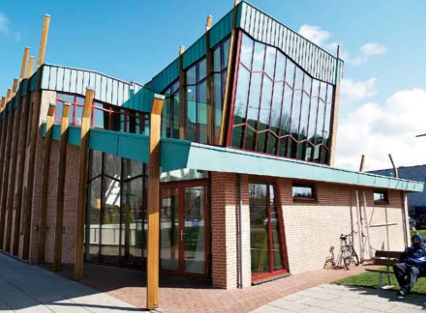
Alkmaarin harjoituskeskus tarjoaa loistavat olosuhteet harjoittelulle.