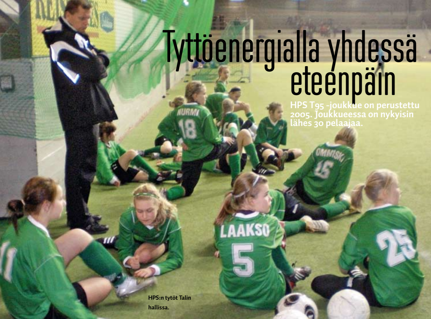
HPS:n tytöt Talin hallissa.

HPS T95 -joukkue on perustettu 2005. Joukkueessa on nykyisin lähes 30 pelaajaa.