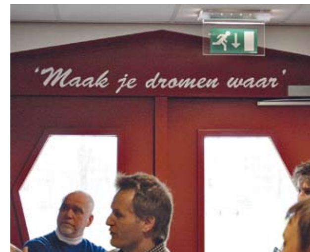
Unelmista totta. Tämän lukee jokainen aina kentälle mennessään.

Seuralla on kahdeksan ammattilaisitarkkailijaa Hollannissa, jotka keskittyvät 16-21-vuotiaisiin pelaajiin. Pelaajia tarkkaillaan ja arvioidaan samojen kriteerien pohjalta kuin seuran omia pelaajikin.