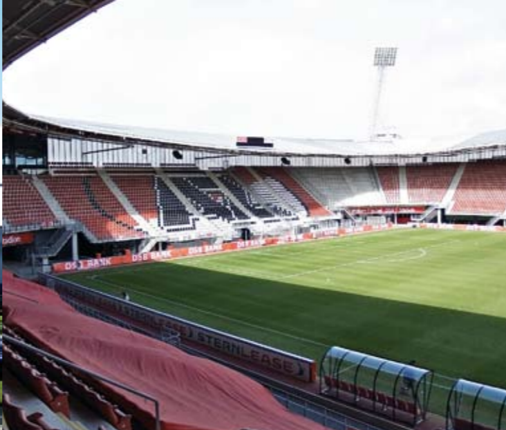
Uusi stadion vetää 17 00 katsojaa.