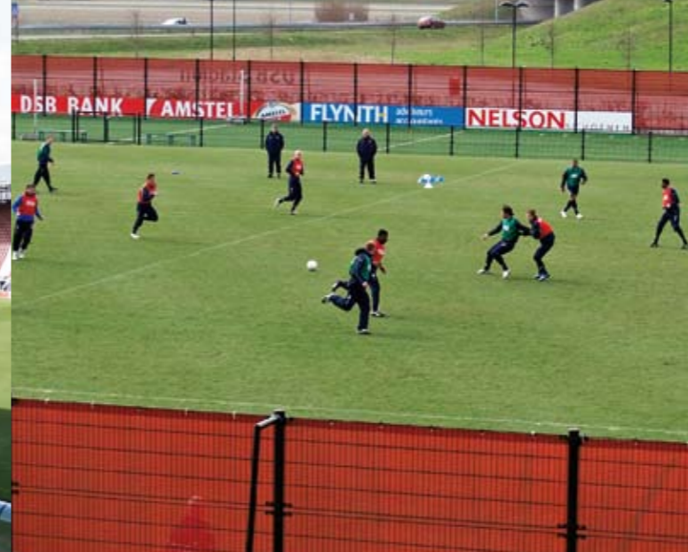
Alkmaarin edustusjoukkue treenaa Louis van Gaalin johdolla.